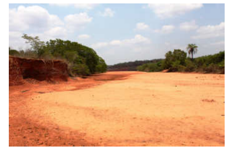
Um rio seco: realidade que é motivo de orações diárias