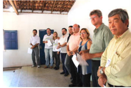
Toda equipe à frente recebe os agradecimentos