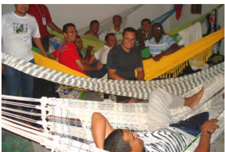
Participantes no dormitório nas redes usuais