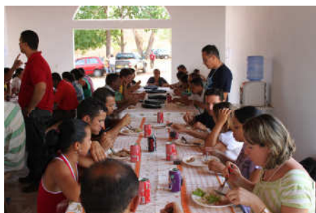
Confraternizando durante as refeições