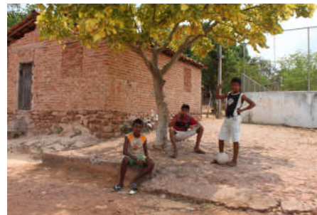
Crianças do vilarejo à espera do jogo de futebol