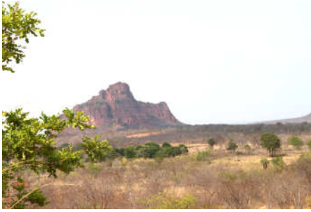
Montanhas próximas a Corrente fazem um lindo cenário...