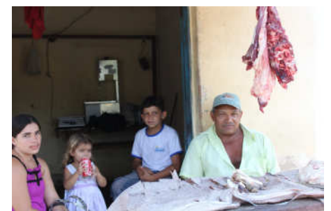
Açougue ao ar livre