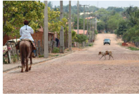
Um vilarejo próximo a Corrente