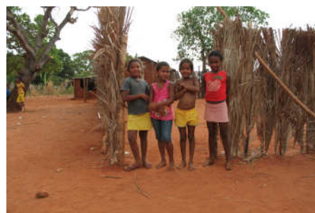
Meninas no portão, ao lado da cerca de palha