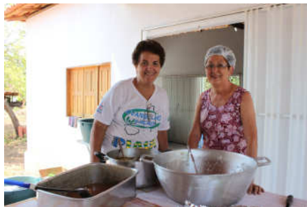
Chefes da cozinha com um sorriso maravilhoso e excelente comida