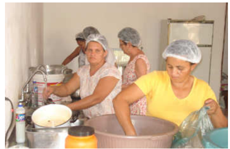
As colaboradoras na cozinha