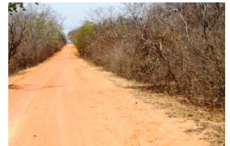
Estradas poeirentas de acesso ao vilarejo