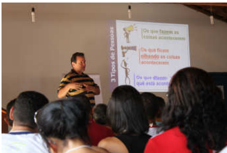
EB ensinando Gestão de Projetos em Neemias