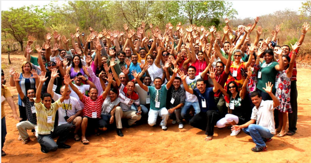
106 participantes - Jornada Haggai no Piauí