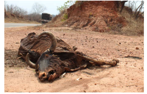
O terrível choque da morte à espreita pela falta de água