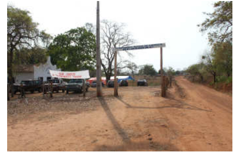
Entrada do Acampamento Batista, a 20 km de Corrente