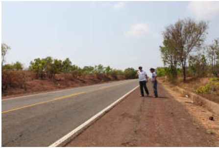
Rodovia pavimentada de ótima qualidade