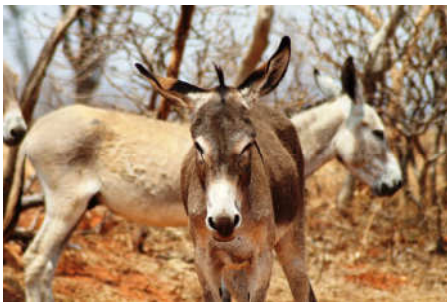
Um grupo de jumentos que pastavam ali perto