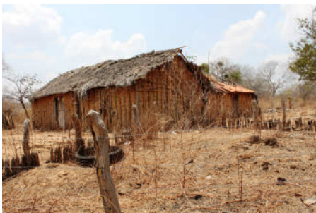
Casa de pau-a-pique ao longo da estrada