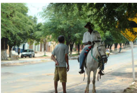
O sertanejo na cidade