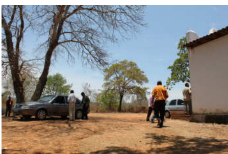
Intervalo do lado de fora da capela