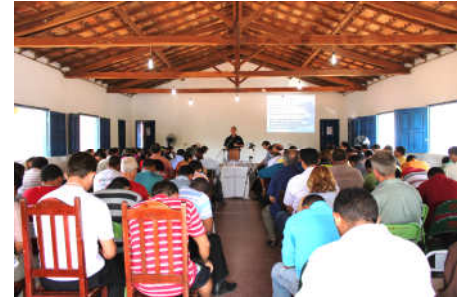
Culto da Ceia e também de testemunhos