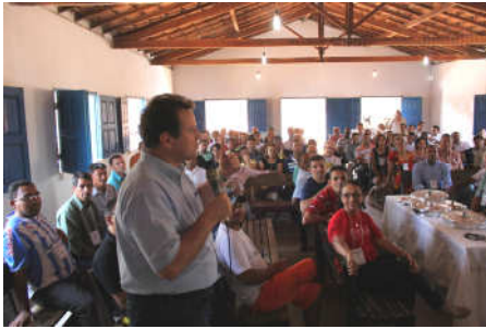
EB agradece a toda equipe por seu trabalho excepcional