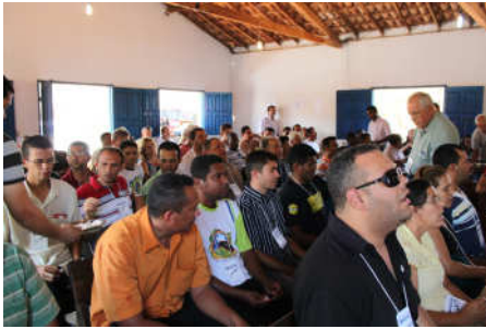
Ceia do Senhor sendo distribuída em momento de adoração e gratidão