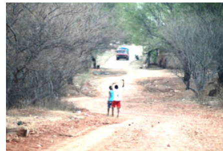
Na entrada do vilarejo: crianças e um carro ao longe