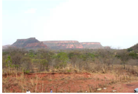
mas a vegetação é seca e deprimente