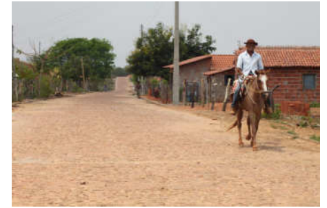
Um vilarejo próximo a Corrente