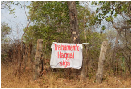
Faixa na cerca, indicando o local do Treinamento Haggai