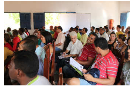
Todos muito participativos nos exercícios e discussões