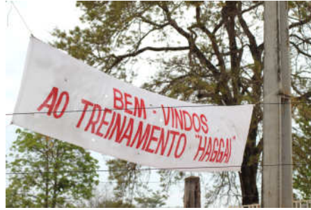
Faixa de boas vindas na porta do Acampamento